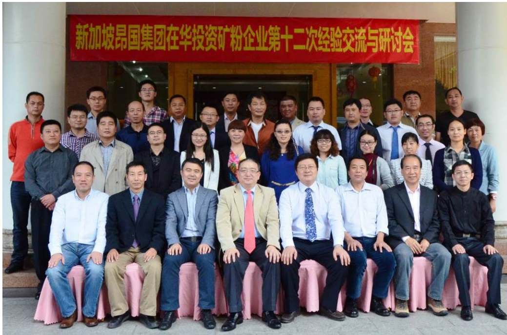
与会代表合影留念