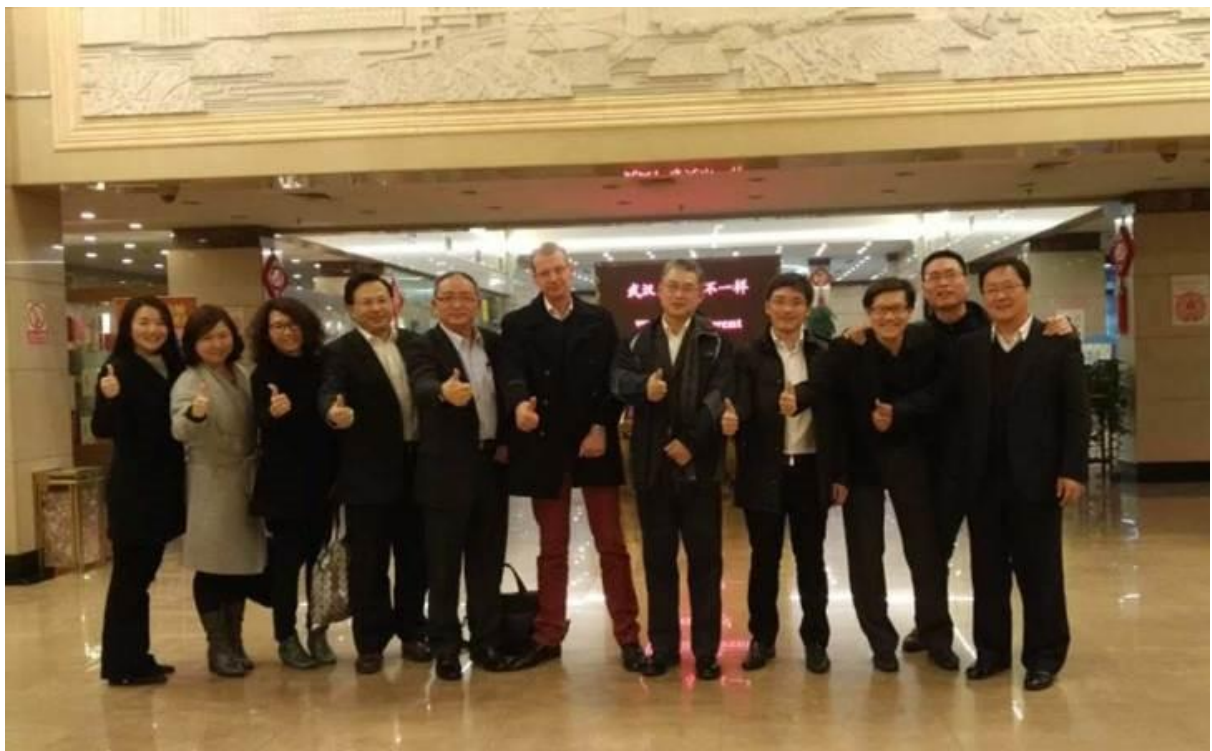
新加坡 CPG 集团高层及新加坡昂国集团代表访问武钢合影